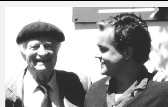
« Un jour, des guerres pourront même éclater, simplement pour empêcher que tes découvertes soient reconnues dans le monde entier », déclarait Linus Pauling, double Prix Nobel, peu avant sa mort en 1994, au Dr Rath.

En tant que scientifique, j'ai découvert qu'il était possible de contrôler les maladies aujourd'hui les plus courantes grâce à des remèdes naturels. J'ai également démasqué les bénéficiaires de cette guerre qui fait rage. Je considère donc qu'il est de mon devoir de lancer un appel aux peuples et aux chefs politiques du monde entier afin qu'ils nous aident sans tarder à construire un « monde sans maladies » !