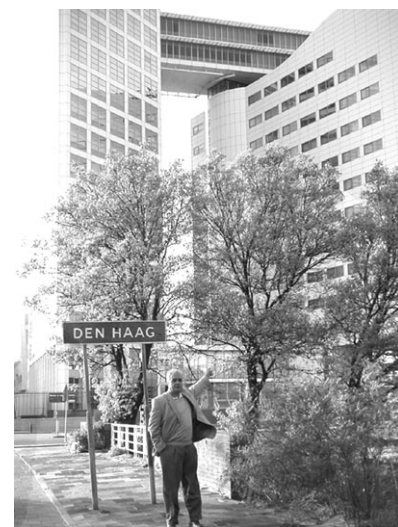
Le Dr Rath en face de la CPI à La Haye

Le Programme du peuple sera officiellement présenté lors d'une conférence internationale à La Haye, Pays-Bas, les 14 et 15 juin 2003. La Haye est la ville où a été installée la Cour Pénale Internationale (CPI) des Nations Unies.