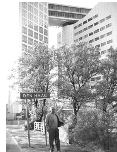
Le Dr Rath en face de la CPI à La Haye

Le Programme du peuple sera officiellement présenté lors d'une conférence internationale à La Haye, Pays-Bas, les 14 et 15 juin 2003. La Haye est la ville où a été installée la Cour Pénale Internationale (CPI) des Nations Unies.