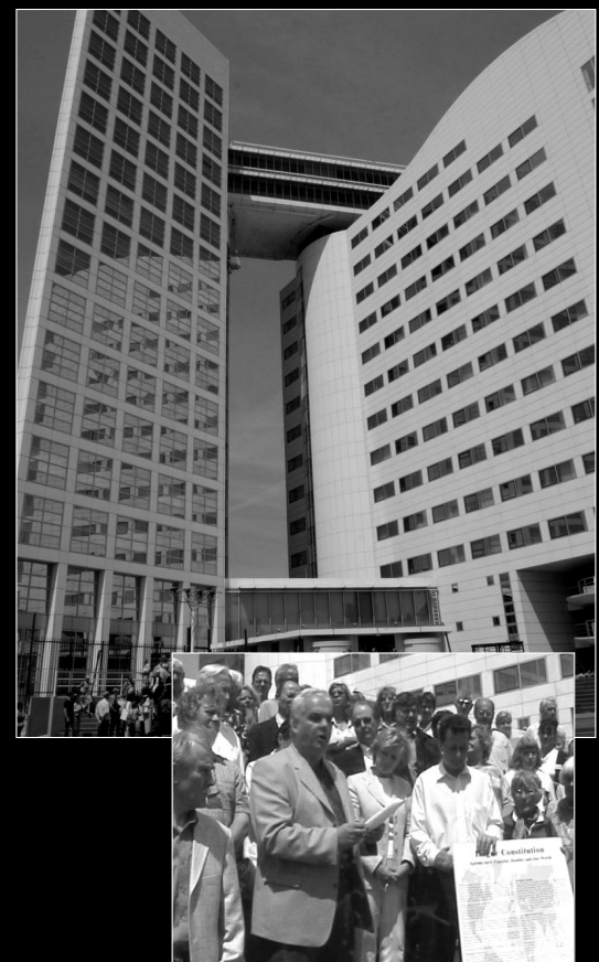
Le Tribunal International des Nations Unies à La Haye

Au nom des Peuples du Monde, pour cette génération et pour les générations à venir : vous devez agir immédiatement pour préserver la paix du monde !